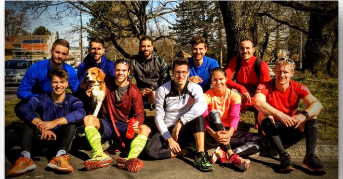
Langsprint Trainingsgruppe des LC Zürich. (inkl. Lord Nelson the beagle)